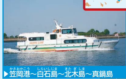
▶ 笠岡港～白石島～北木島～真鍋島

高速船「ニューかさおか」で、笠岡の大小の島を見ながら45分。真鍋島のネコたちが、海辺の堤防でむかえてくれるよ。平安時代の史跡や、島の歴史を伝える資料館などにも行ってみよう。