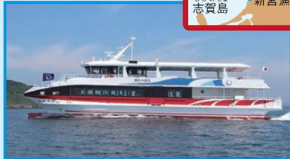
▶新宮町新宮漁港～相島

「しんぐう」で20分の相島では、およそ300人の島民と100匹のネコがくらししている。島のネコの調査により、オスが子育てするようすをとらえることに成功。世界ではじめての大発見だったよ。