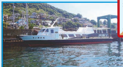
▶ 上天草市江樋戸港～湯島

湯島は、ネコに会いにくる人大かんげい。えさを売るお店もあれば、ネコのたまり場を看板で教えてくれたりと、いたれりつくせりだ。「第二昭和丸」からおりと、文字どおりネコの楽園にゃのだ。