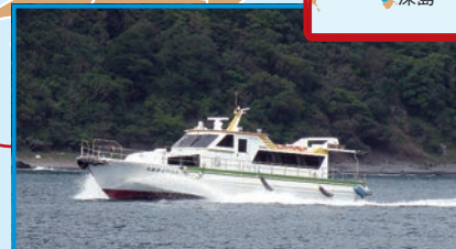
▶ 佐伯市蒲江港～屋形島～深島

「えばあぐりいん」で30分の深島には、約100匹のネコがすむ。みんな、島の人に名前をつけてもらって、かわいがられているよ。きれいなサンゴ礁の海で、マリンスポーツにも挑戦したいね。