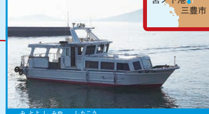
▶ 三豊市宮ノ下港～志々島

「つばめ」に乗って20分の志々島では、ネコとならんでヤギも人気。かわい子ヤギに会えるかも。島のシンボルのクスノキは、なんと樹齢1200年! 大きく広がる枝の下は、なぜか心が安らぐ。