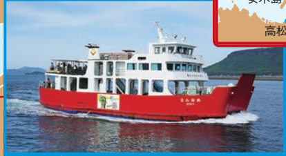
▶ 高松港～女木島～男木島

赤と白の愛らしい「めおん2」で、夫婦島の男木島と女木島へ。海辺や公園などに、さまざまなネコがいる。女木島の別名は、鬼ヶ島。桃太郎伝説や鬼にまつわる観光名所を回るのも楽しいね。