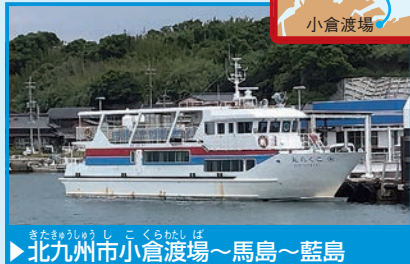
▶北九州市小倉渡場～馬島～藍島

ネコ密度が高い2島を結ぶ「こくら丸」は、地元の人々の足であり、夏場は釣り客も多い。時間に余裕を持って港へ行こう。藍島は化石が出ることで有名。船から見る、北九州工業地帯も圧巻だ。