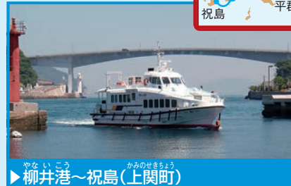
▶柳井港～祝島(上関町)

むろつ 室津半島から長島を経て、小型船「いわい」で1時間あまり、独特の石積みへの美しい集落で、くつろぐネコたちに会える。「天空の棚田」とよばれる、海を見おろす雄大な棚田も見に行こう。