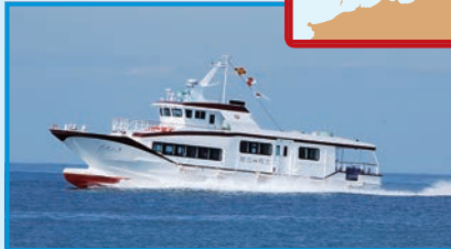
▶糸島市岐志渡船場～姫島

「ひめしま」にゆられて15分、姫島で江戸時代にタイムスリップ。鎖国中に外国船の見張りをした番所や、幕末にかつやくした女性、野村望東尼の史跡がある。ネコの声を聞いて、現実にかえろう。