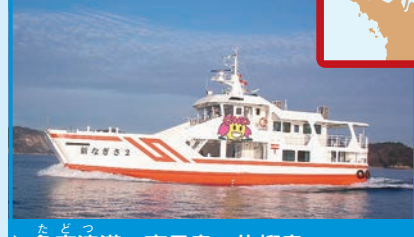
▶ 多度津港～高見島～佐柳島

「新なぎさ2」が結び2つの島で、写真に挑戦。高見島では、集落のあちこちに見られる古い石垣とネコが絵になるよ。また、佐柳島の防波堤は、ジャンプするネコの写真スポットとして有名だ。