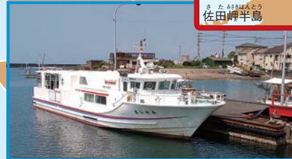
▶大洲市長浜港～青島

2018年の時点で、島の人口は10人以下、ネコは200匹以上。青島は、まさにネコだらけだ。食べ物、飲み物を用意して、朝の「あおしま」でわたれば、たっぷり遊べる。えさやりのルールを守ろうね。