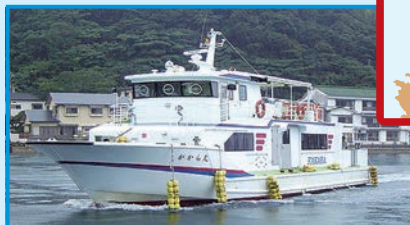
▶ 唐津市呼子港～加唐島

切り立ったがけに囲まれた加唐島は、古くから朝鮮と交流があり、神秘的な伝説が残る。ネコは人なつこい子が多いといわれているよ。イカで名高い呼子港から「かから丸」が1日4便出ている。