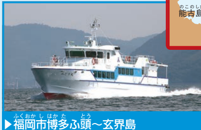
▶福岡市博多ふ頭～玄界島

玄界島は、県の中心部からのアクセスが便利。ベイサイドプレイスというレジャー施設から、「みどり丸」にひよいと乗ってみよう。島でネコとすごした帰りには、博多湾の夜景がむかえてくれる。