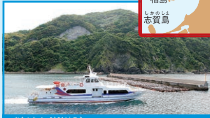
▶宗像市神湊港～地島

神湊港から「ニューじのしま」で15分の地島では、2つの港がネコのたまり場。ヤブツバキがおいしげる山中の、つばきロードを歩いて、港から港へ移動しよう。ツバキの実からとる油は特産品。