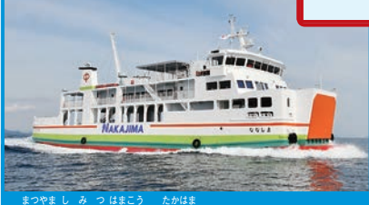
▶ 松山市三津浜港～高浜～睦月島～野忽那島

2つの島は、フェリー「ななしま」で20分ほどのおとなりさん。港のまわりで、たくさんネコに会える。睦月島では長屋門のある古民家、野忽那島では皿山からの瀬戸内海のパノラマも見どころ。